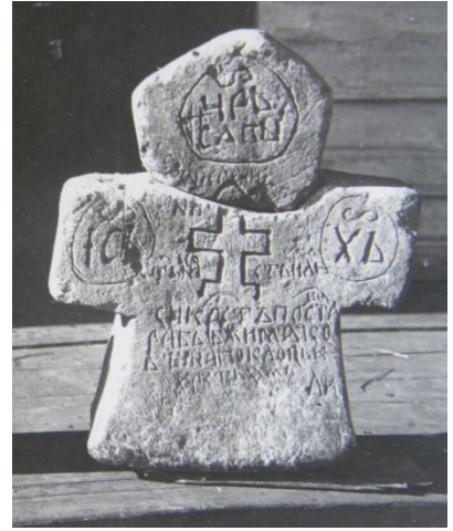
Рис. 5. Памятные кресты любытинского типа.