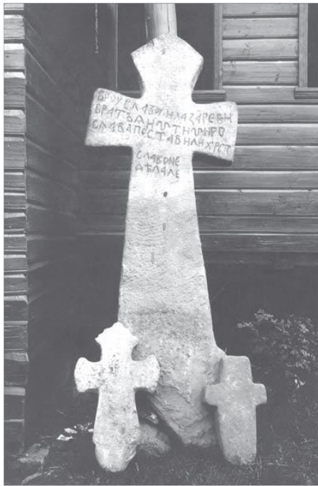
Рис. 1. Воймерицкий крест. Фотография 1898 г.

2. Крест из деревни Клишино. Крест был обнаружен и вывезен археологами Новгородского музея Ершевым Б. Д. и Конечким В. Я. из деревни Клишино Любытинского района в 1977 - 1978 гг. Крест находился вместе с другими небольшими каменными крестами вблизи того места, где раньше стояла часовня. В настоящее время крест экспонируется в музее деревянного зодчества Витославицы в интерьере церкви Рождества Богородицы из села Перёдки. Крест четырёхконечный – с прямо обрубленными боковыми ветвями, слегка расширяющейся заострённой на конце верхней ветвью и нижней ветвью, расширяющейся к основанию. В средокрестии находится, рельефное изображение четырёхконечного крестика, повторяющее форму основного креста (все остальные изображения и надписи на кресте вырезаны контррельефными линиями). На верхней лопасти креста вырезано изображение восьмиконечного креста с одной лишней горизонтальной перекладиной, практически десятиконечного (лишняя перекладина вероятно была изображена по ошибке). По сторонам этого десятиконечного креста расположены аббревиатуры: «ІСЪ ХЪ» и аббревиатура, не поддающаяся однозначному прочтению и расшифровке: «НН» или «ИИ». Ниже расположена надпись: «СТЫ. ИЛ[Ъ]Я». Ещё ниже в средокрестии вокруг рельефного крестика расположены аббревиатуры: «ЦРЬ СЛАВЫ ІСЪ ХЪ НИКА». В свою очередь на самом рельефном крестике тонкими линиями изображён восьмиконечный крест на П-образном