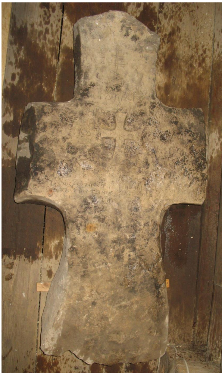
Рис. 2. Крест из деревни Клишино.

3. Крест из деревни Никулино. Крест был выявлен Л. Е. Красноречьевым в 1960 г. при обследовании церкви Успения Богородицы 1599 года. В 1975 году каменные кресты, находившиеся в церкви, были перевезены вместе с церковью в музей деревянного зодчества Витославицы. Длительное время крест находился в церкви Рождества Богородицы из села Перёдки, в 2014 году он экспонировался на выставке «415 лет церкви Успения Богородицы из деревни Никулино». В настоящее время крест находится в фондах НГОМЗ. Крест четырёхконечный – с прямо обрубленными боковыми ветвями, расширяющейся, заострённой на конце, верхней ветвью и нижней ветвью, расширяющейся к основанию, разломан на